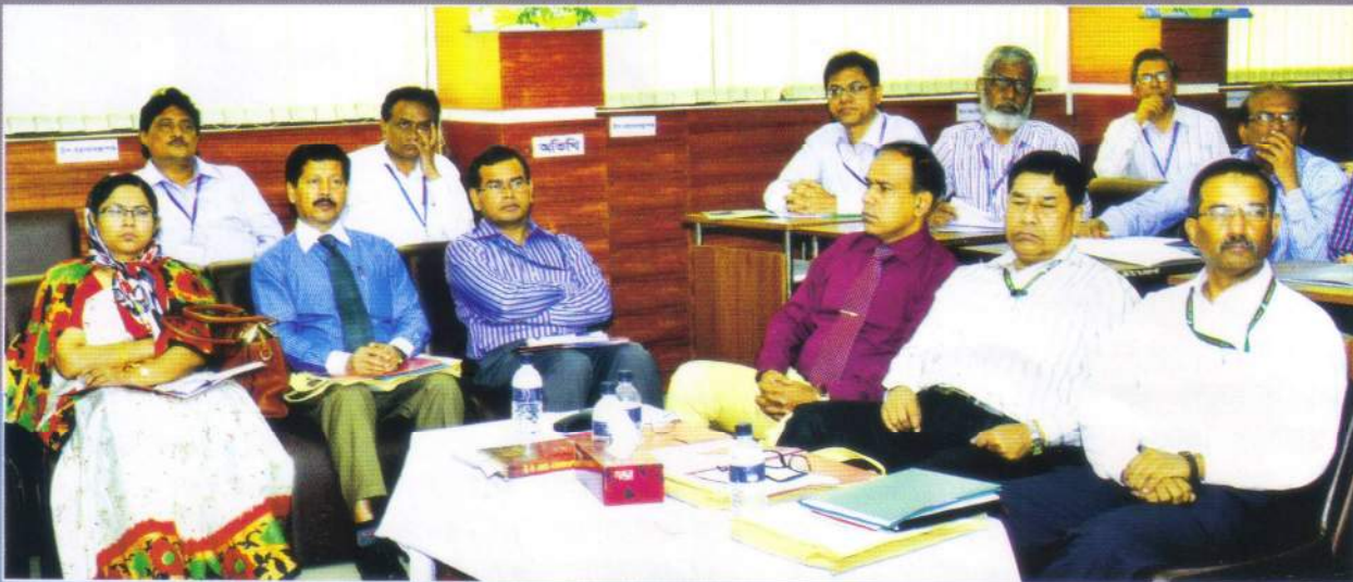
সেমিনারে অংশ গ্রহনকারী দুদক, মন্ত্রণালয়ের ব্যাংক ও আর্থিক প্রতিষ্ঠান বিভাগ, বাংলাদেশ ব্যাংক এবং বিএইচবিএফসি’র উর্ধ্বতন কর্মকর্তাদের একাংশ